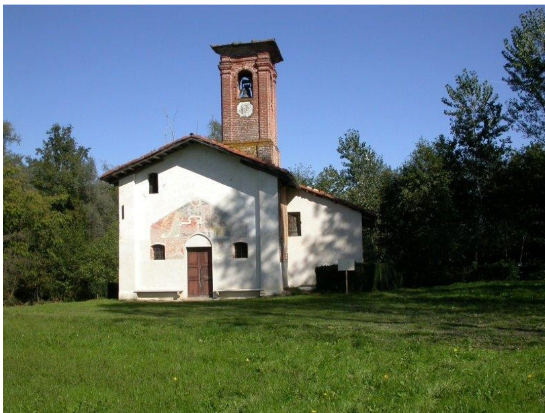
Cappella di Missione.

La drammaticità dei volti di questa scena, come anche la strana luce di altri visi di santi e di madonne in questa stessa cappella deriva da una tonalità molto particolare dell'incarnato. Dux Aymo otteneva questo effetto originalissimo ed efficace dipingendo i volti inizialmente con uno strato verdastro che ricopriva successivamente col rosato della pelle. Si può osservare questo espediente soprattutto nel volto dolente della madre ma anche in quello della Maddalena che bacia la mano del Cristo nonchè nei volti di molti dei Santi sulle pareti laterali.