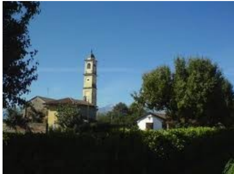
La Cappella di Stella di Macello

Sotto il profilo architettonico, la Cappella di Stella di Macello si presenta estremamente semplice e risale probabilmente agli inizi del Quattrocento.