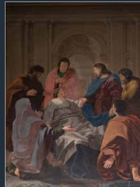
3 - Alberico Carlini da Vellano, Cristo resuscita la figlia di Giairo

Nel presbiterio si possono ammirare: sopra la mensa maggiore un Crocifisso ligneo seicentesco, di buona fattura ma molto ridipinto e sulla parete sinistra una tela raffigurante Cristo che resuscita la figlia di Giairo (fig. 3), assegnato alla fase matura del Carlini per le note raffaellesche e romane.