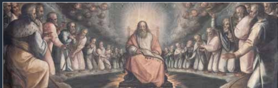
1 - Pittore di fine XVI secolo, Visione dell'Apocalisse (part.)