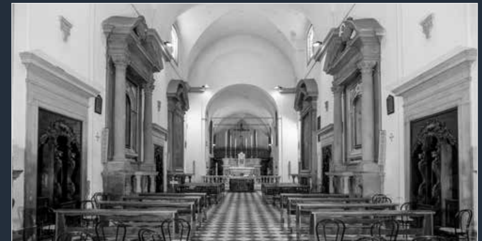
4 - La chiesa dedicata a San Lodovico di Tolosa (interno)

Nella Cappella di Santa Chiara era un San Ludovico di Tolosa in gloria (1723) del pittore senese Annibale Mazzuoli, oggi trasferito – insieme ad un dipinto che si trovava in sacrestia e ispirato alla Pietà di Michelangelo attribuito da fonti settecentesche a Santi di Tito – nel convento di San Francesco a Fiesole.