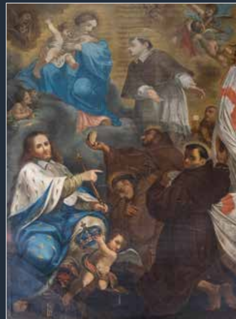
2 - Alberico Carlini da Vellano, Madonna con san Carlo Borromeo, San Ludovico re e santi

Cinquecento), caratterizzata da un cromatismo tardomanierista e riconosciuta al pittore genovese Giovan Battista Paggi, attivo per venti anni in Toscana ( in copertina ).