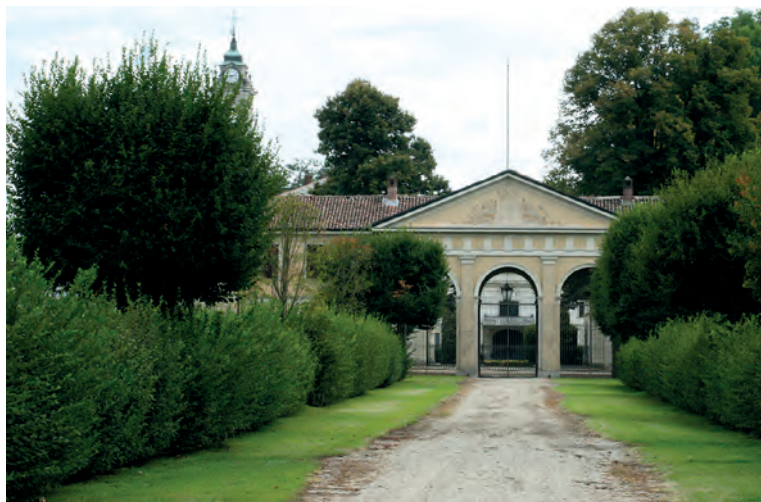
L'ingresso della villa padronale.

Apollinare Rocca Saporiti fece ricostruire, secondo lo stesso stile, dall'arch. Giacomo Moraglia, la chiesa, che però mantenne la stessa collocazione e lo stesso orientamento. Infatti la chiesa attuale sorge sulla stessa area sulla quale risulta (dal Catasto Teresiano) la precedente chiesa quattrocentesca, coeva alla costruzione del Colombarone, e fu ideata come completamento della villa padronale. La facciata principale sulla strada presenta colonne e lesene con capitelli corinzi, posati su un alto basamento di granito e sormontati da un timpano con bassorilievo che riproduce lo stemma della famiglia Rocca Sa-