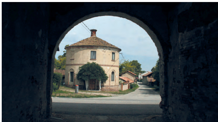
La Casa Rotonda vista da uno dei cancelli di accesso del Colombarone.

giornò in questa abitazione, mentre studiava come migliorare l'idraulica delle marcite qui alla Sforzesca.