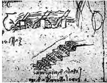
Leonardo, disegno della scala d'acqua della Sforzesca (Codice Leicester).

- marzo 1494 e realizzati a Vigevano, che ritraggono una scala sulla quale scorre l'acqua; a questi disegni si riallaccia, nel manoscritto Leicester, l'illustrazione di un meccanismo per diminuire la velocità dell'acqua e quindi la potenza della sua caduta. In concreto, il progetto fu realizzato proprio alla Sforzesca presso il mulino detto "della Scala" per la "scala d'acqua" che Leonardo ideò per regolare il flusso del canale che lo faceva funzionare. Purtroppo, di questa scala d'acqua oggi restano pochissime tracce.