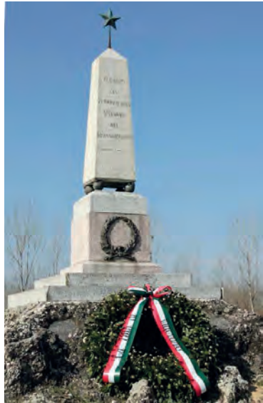
Monumento commemorativo della battaglia della Sforzesca, 1849.

Al marchese Apollinare subentrarono, nella proprietà dei beni pa-