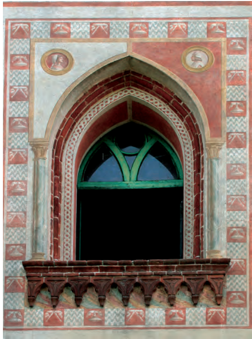
La finestra con i ritratti di Ludovico il Moro e di Beatrice d'Este (in alto un ingrandimento).

2014-15, passano quasi inosservati: sono i medaglioni ai lati di una finestra gotica del primo piano. Le piccole dimensioni, 20 cm. di diametro ciascuno, e l'altezza dal piano di calpestio in cui si trovano rendono la lettura difficoltosa. Eppure all'interno di così poco spazio sono dipinti i ritratti di Ludovico il Moro e di Beatrice d'Este. Non possiamo essere certi che proprio ai lati di quella finestra in origine ci fossero i ritratti dei due coniugi signori di Milano, perché sulla superficie muraria non