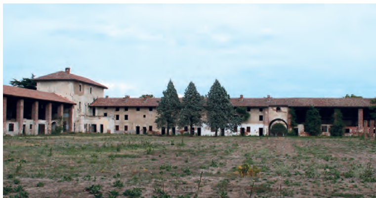
Il cortile interno del Colombarone.

è rimasta traccia, se non una parziale incisione sull'intonaco delle cornici dei medaglioni. Però è sembrata cosa giusta riprodurre le immagini di colui che con grande volontà e passione aveva voluto realizzare nel 1486 questo imponente complesso agricolo e dedicarlo alla moglie. I ritratti sono copie sia delle lunette della casa degli Atellani di Milano, attribuiti a Bernardino Luini, sia delle loro riproduzioni sulla Piazza Ducale di Vigevano.