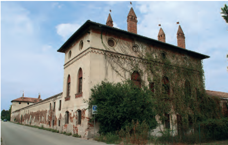
Il Colombarone visto dall'angolo sud-ovest.

Successivamente, nel 1924-25, su richiesta del marchese Alessandro Rocca Saporiti, che aveva ereditato l'antico borgo dal fratello Marcello, Ottone eseguì dei bozzetti ad acquerello per la decorazione del colombarone di nord-est, riconoscibile per il disegno del camino aggettante, bozzetti conservati oggi presso l'Archivio della Soprintendenza di Milano (Palazzo Litta). Questo lavoro non fu mai realizzato, ma il ritrovamento dei progetti e di alcuni lucidi a grandezza reale sono stati di grande aiuto per la ricostruzione dell'apparato decorativo durante i restauri, eseguiti nel 2014-2015 da Mauro Nicora per conto del Comune di Vigevano.