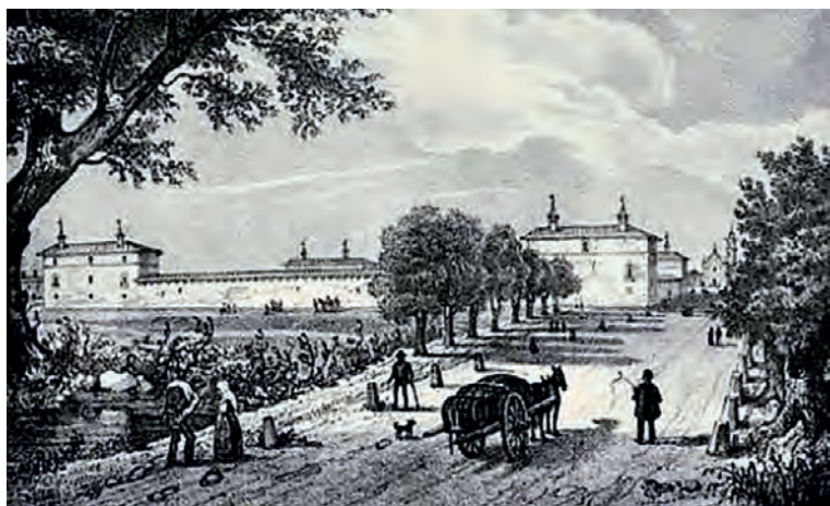
La Sforzesca in una stampa ottocentesca.