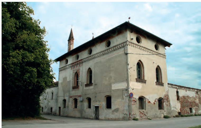
Colombarone, angolo nord-ovest.

dentelli, al di sopra delle quali si aprono finestre a occhio tondo nel sottotetto.