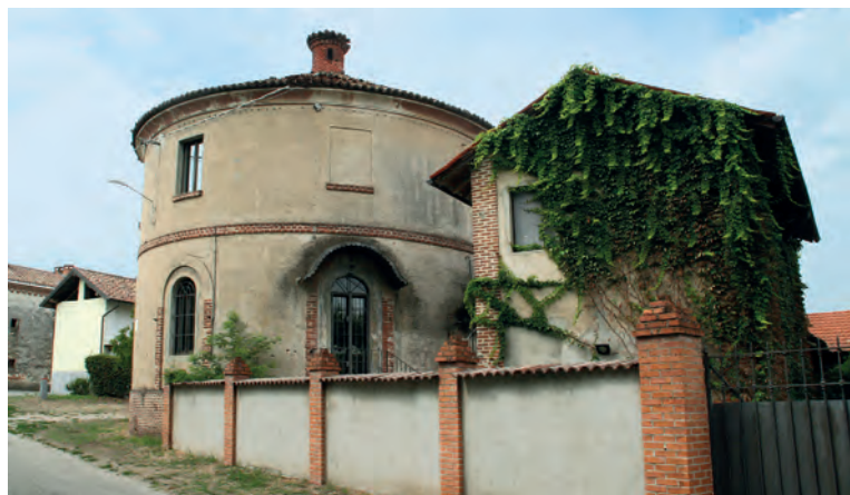
Il retro della Casa Rotonda.

Qui sono passati grandi uomini, signori d'arme, nobili, principi e i migliori architetti dell'epoca rinascimentale. Leonardo da Vinci sog-