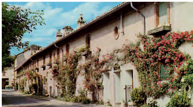
La via dei Fiori alla Sforzesca.

quanto travagliata e intrecciata di vari matrimoni. Nel 1803 la tenuta fu venduta da Quirino Cazenove al nobile genovese Marcello Saporiti; grazie al suo spiccato spirito imprenditoriale e mettendo a frutto i contatti con l'ambiente torinese, egli riuscì a creare alla Sforzesca una vasta e fiorente azienda, composta da cinque grandi fattorie e comprendente i diritti sulle rogge e sui canali della zona. Costituì, così, una grandiosa tenuta di più di 1600 ettari, avviò la costruzione della villa padronale e di numerose case a schiera per dipendenti e contadini, case che ancor oggi costituiscono il nucleo storico e caratteristico della frazione vigevanese della Sforzesca. Nel 1845 il re di Sardegna Carlo Alberto eresse la Sforzesca a marche-