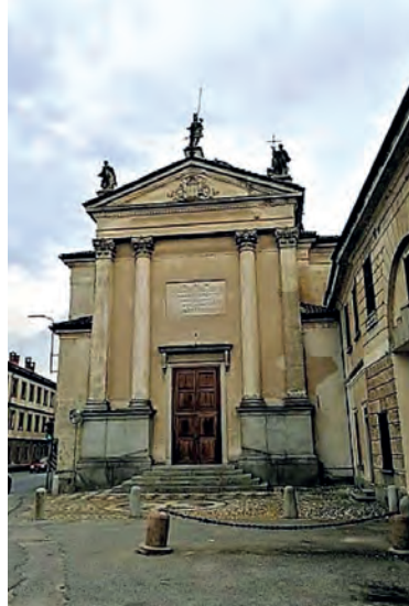
La chiesa di S. Antonio Abate.

La chiesa costituisce un suggestivo fondale prospettico rispetto all'asse stradale per chi proviene da Vigevano e, insieme alla villa