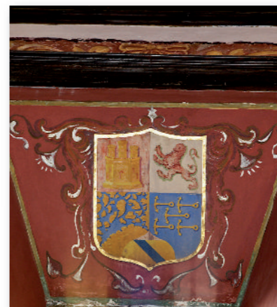
6 Escudo de Castilla.

A la izquierda del altar mayor el retablo de San José 8. Se trata de un retablo de línea barroca, con una única hornacina central que repite el esquema de las hornacinas del retablo mayor, que cobija la imagen de San José con el Niño Jesús sentado sobre su brazo izquierdo. Se trata de una escultura con la cabeza de madera policromada, el cuerpo ejecutado con telas encoladas e interior relleno de paja. Por sus características estilísticas puede datarse del siglo XVIII y parece ser que originariamente estuvo situado en el altar mayor.