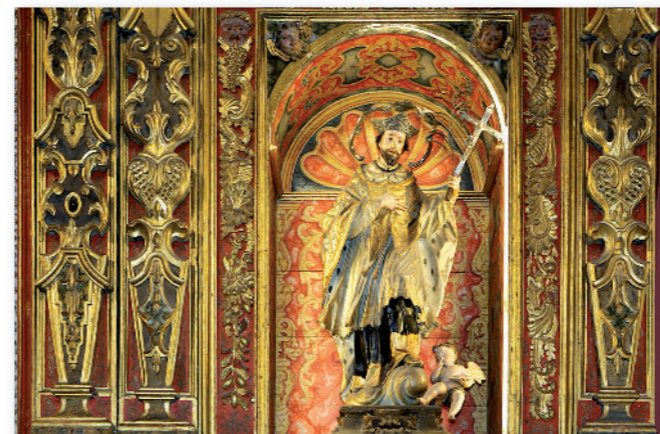
5 San Juan de Nepomuceno.

A los lados del retablo mayor se puede reparar en dos pinturas murales: 6 el escudo de Castilla con una leyenda explicativa debajo a la izquierda, y a la derecha del retablo 7 una pintura de los Reyes Católicos. Estas pinturas no corresponden a cuando se rehabilitó la ermita, sino son bastante posteriores. Posiblemente su propósito fuera el resaltar la idea de la estancia colombina en la ermita , retratando por ello a los reyes Isabel y Fernando, que sufragaron el viaje de Colón, y el escudo de Castilla que incorpora en la parte inferior las tierras americanas descubiertas en su reinado.