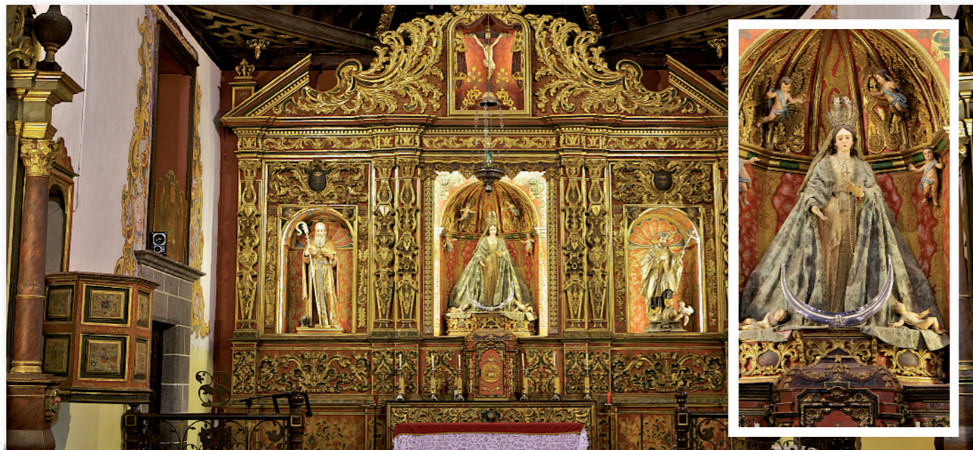
2 Retablo mayor.