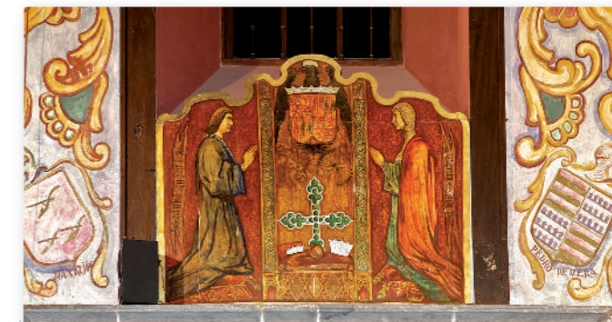
7 Pintura de los Reyes Católicos.

En la parte superior del retablo , rematando al mismo se encuentra una pintura en óleo sobre lienzo, de formato mediano que representa la figura de San Miguel. Esta pintura debe ser adscrita a lo mejor de la producción de Juan de Miranda y puede ser datada en torno a 1795.