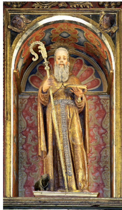
4 San Antonio Abad.