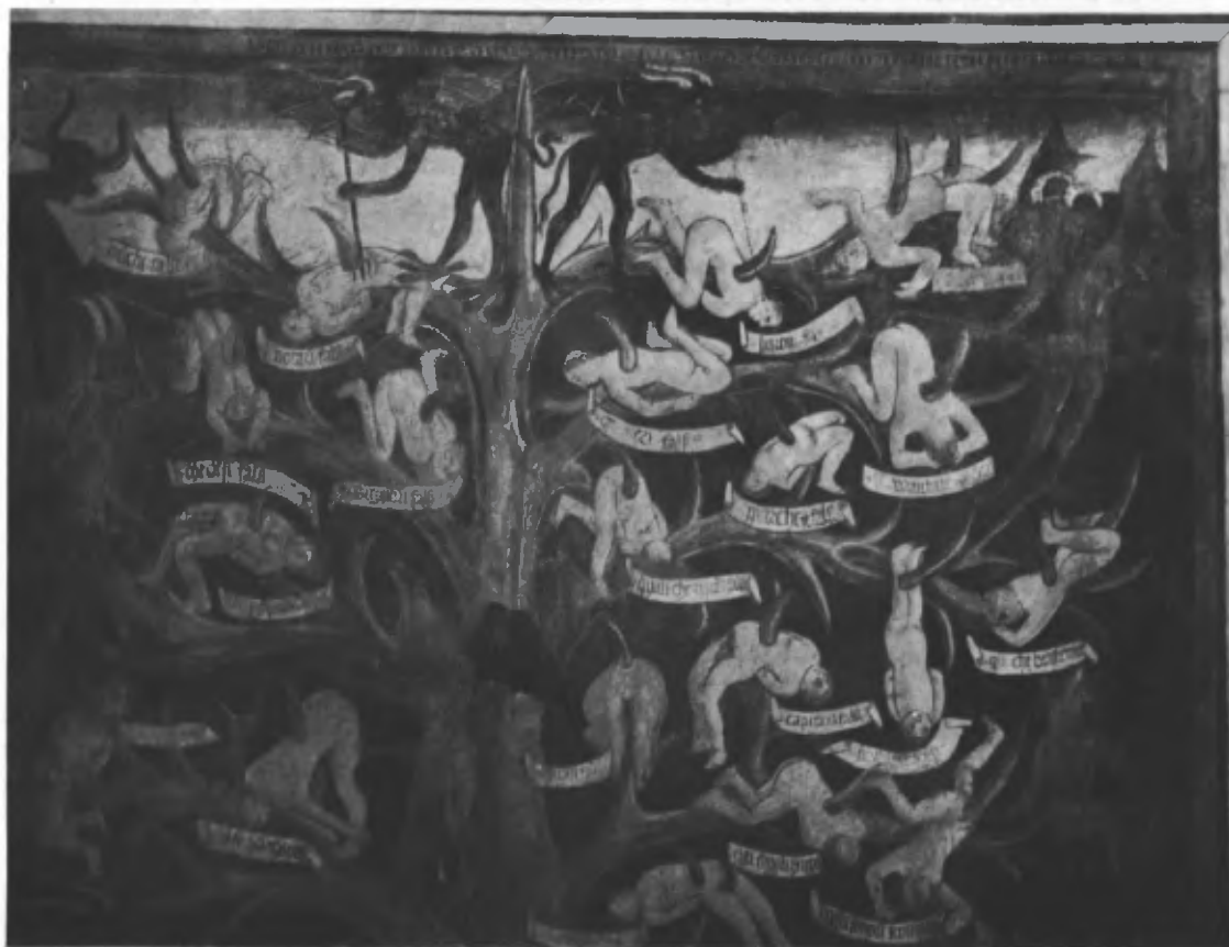
Fig. 28. L'estremità superiore dell'albero con i suppliziati.