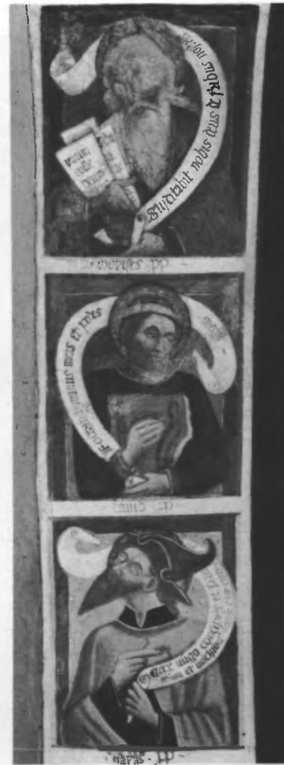
Fig. 45. Sott'arco dell'abside: Isaia, Davide, Mosè.