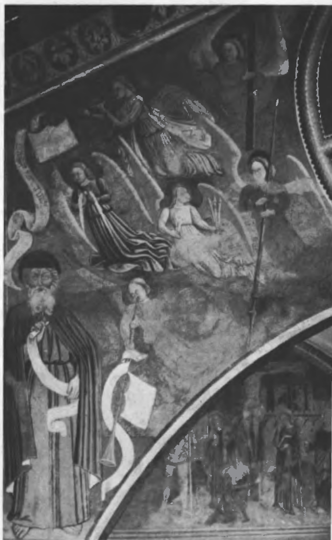
Fig. 34. Gli altri sei angeli e il santo, all'altro lato del Pantocratore.