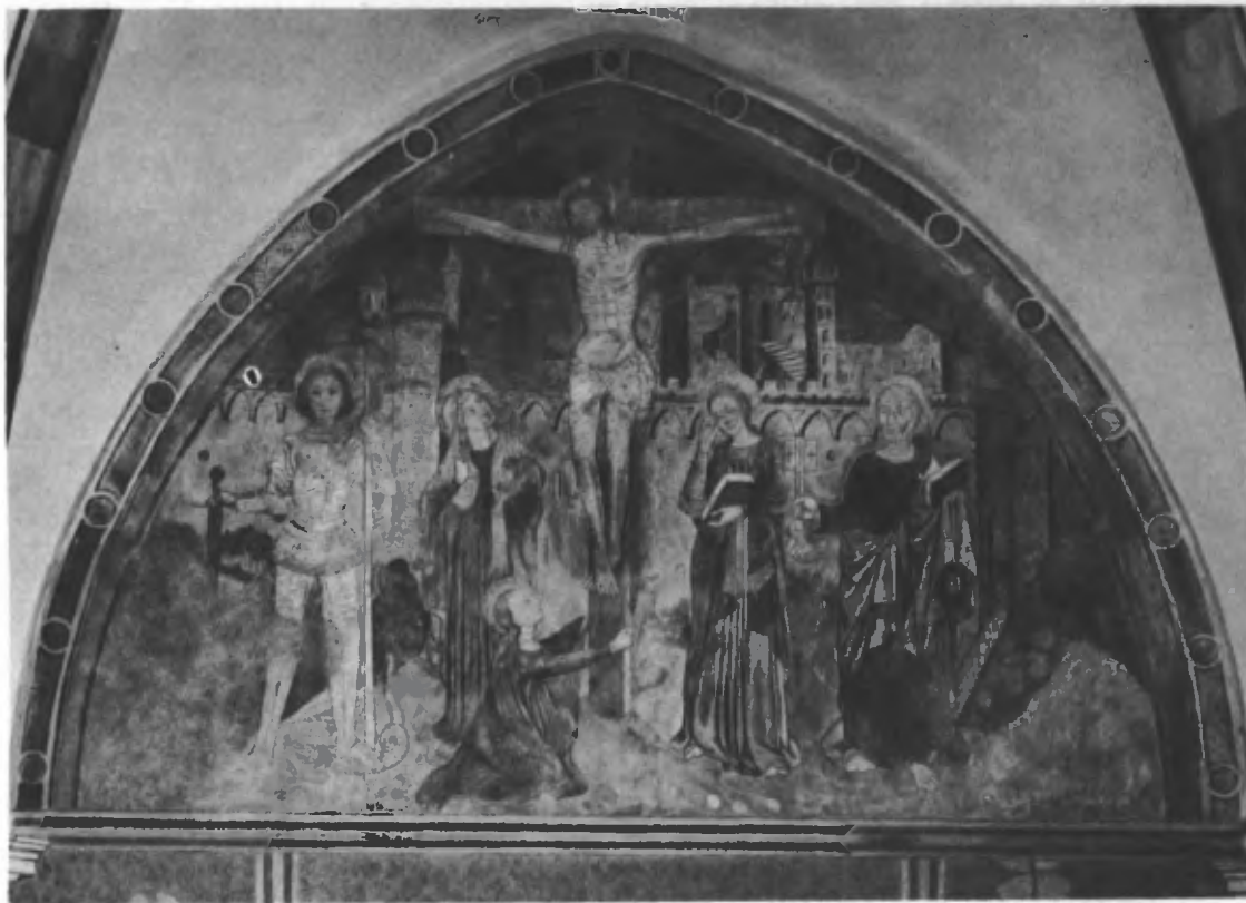
Fig. 46. Lunetta di fondo dell'abside con san Giorgio, la Madonna, la Maddalena, il Crocifisso, san Giovanni evangelista, san Pietro.