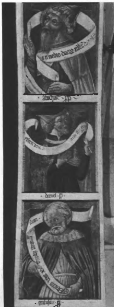
Fig. 42. Sott'arco dell'abside: Malachia, Daniele, Abacuc.