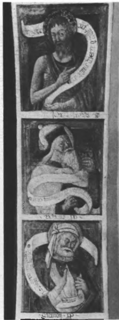
Fig. 43. Sott'arco dell'abside: Salomone, Zaccaria, Giovanni Battista.