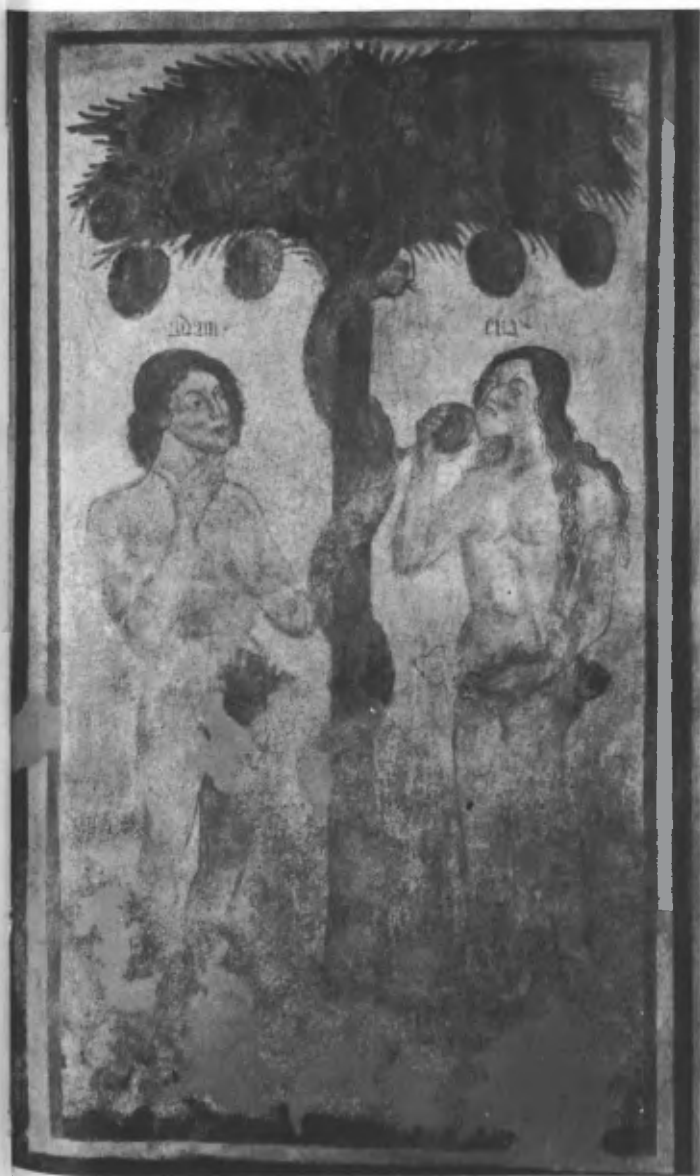
Fig. 4. Parete settentrionale: Adamo e Eva.