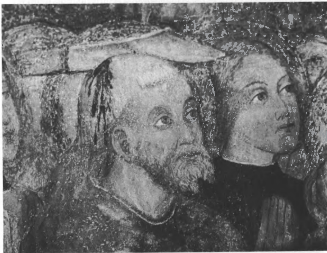
Fig. 13. San Pietro martire (particolare dei beati).