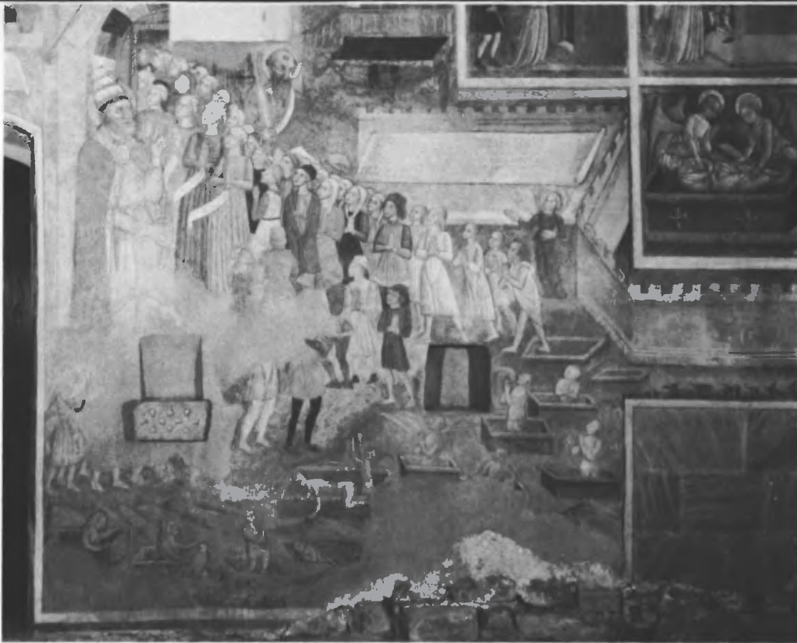
Fig. 10. La resurrezione dei defunti e l'ascesa dei giusti al paradiso; sulla sinistra è visibile l'acquasantiera altomedioevale.