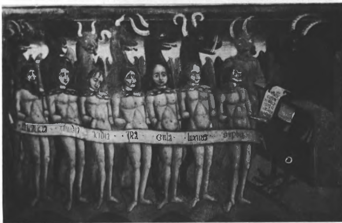
Fig. 24. I sette vizi capitali (particolare dell'inferno).