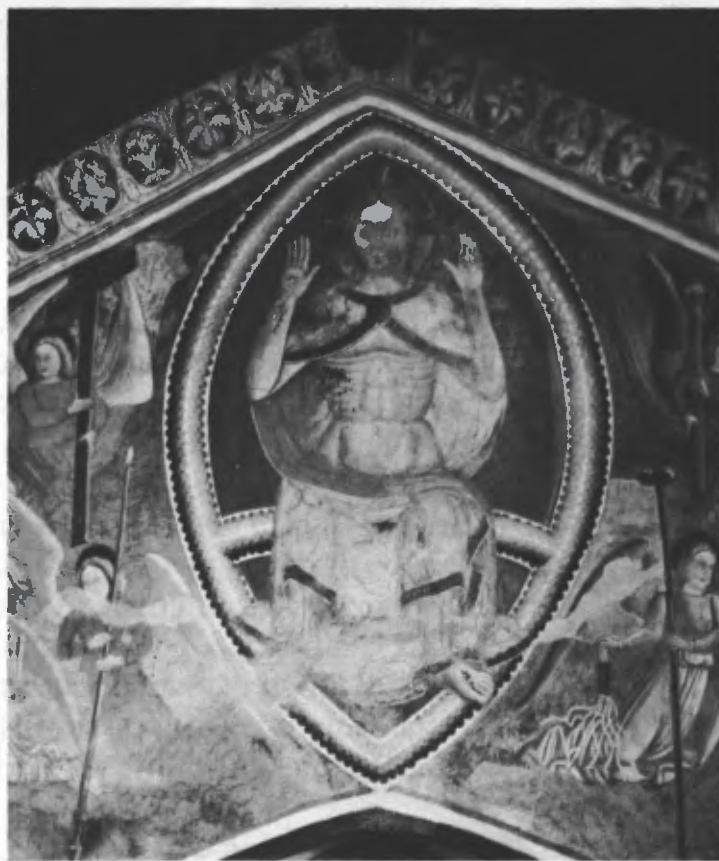
Fig. 32. La mandorla con la figura del Pantocratore (particolare dell'arco trionfale).