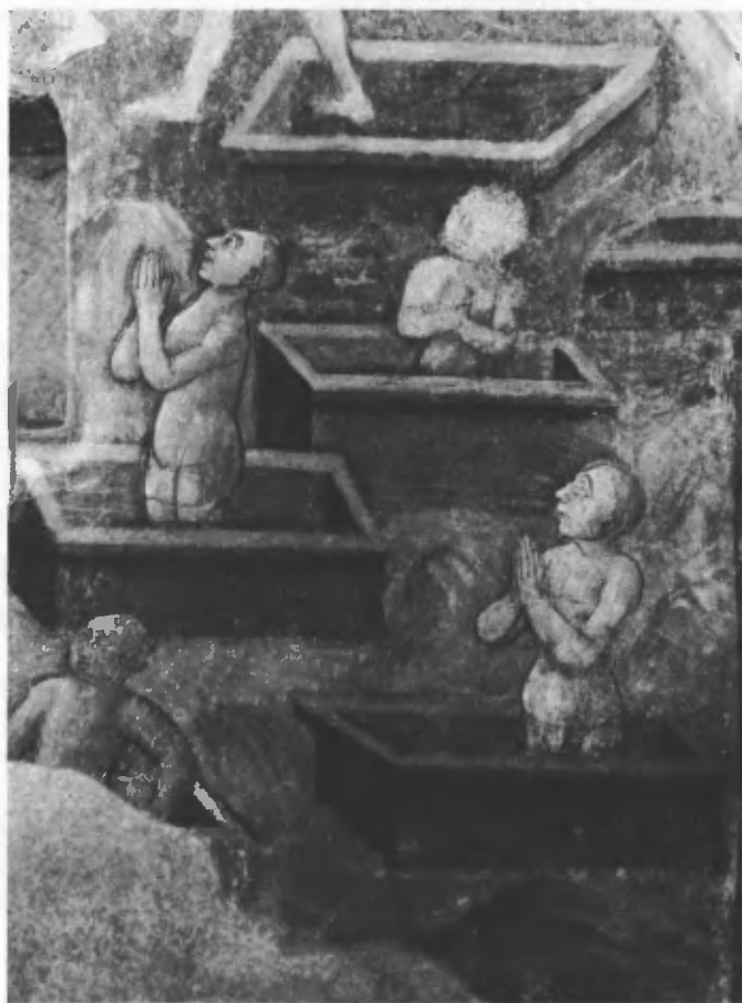
Fig. 11. La resurrezione dei defunti (particolare).