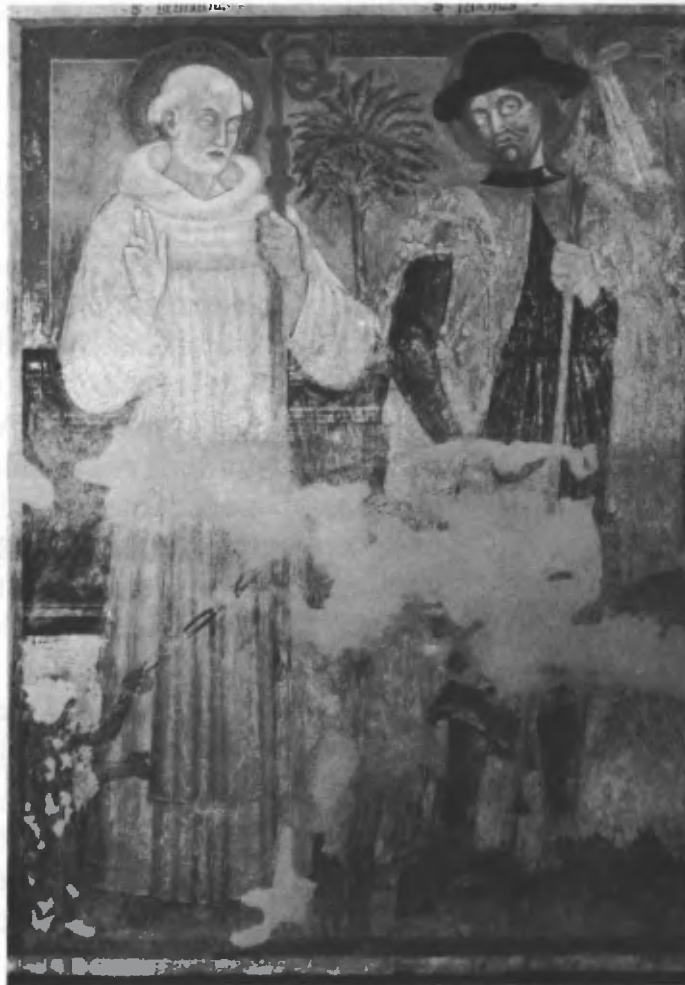
Fig. 3. Parete settentrionale: san Bernardo e san Rocco.