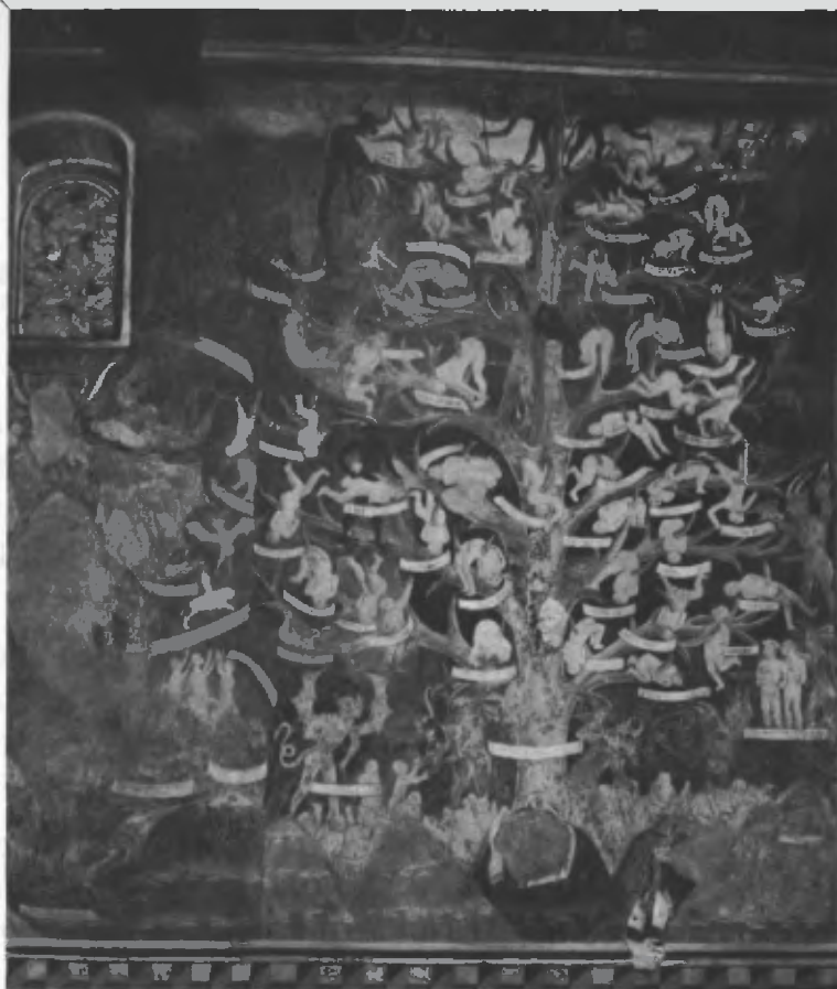
Fig. 27. Parete meridionale: il lato destro dell'inferno.