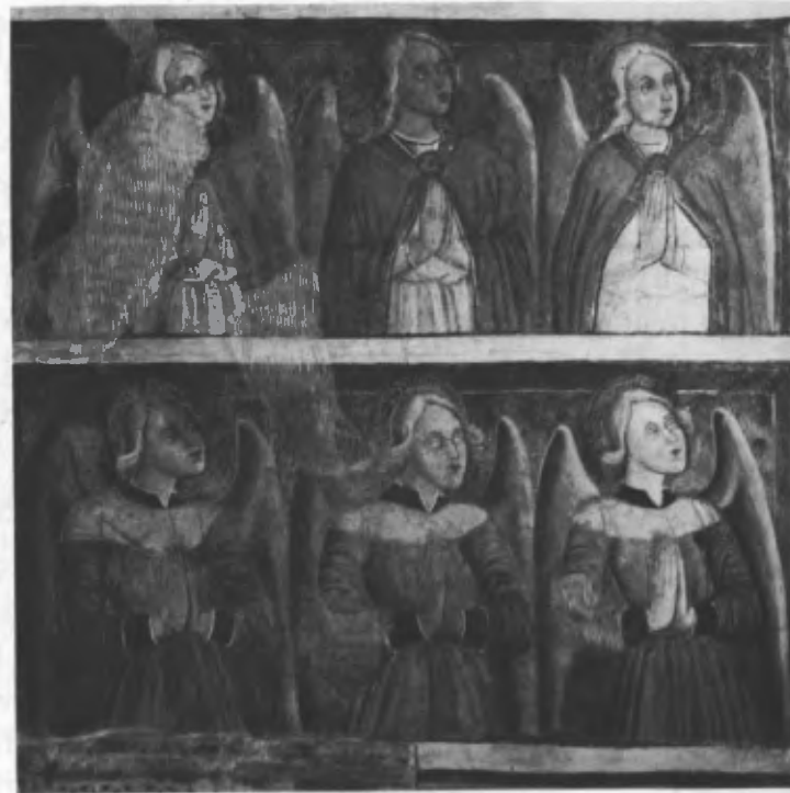
Fig. 39. Particolare dei cori angelici.