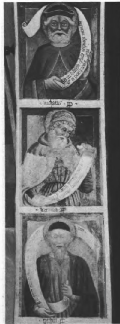
Fig. 44. Sott'arco dell'abside: Ezechiele, Geremia, Michea.