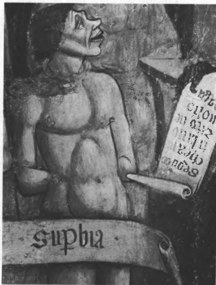
Fig. 26. La superbia (particolare dei sette vizi capitali).