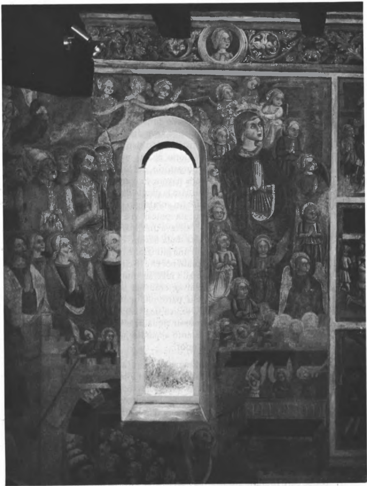
Fig. 7. Particolare del paradiso con la Madonna circondata da angeli.