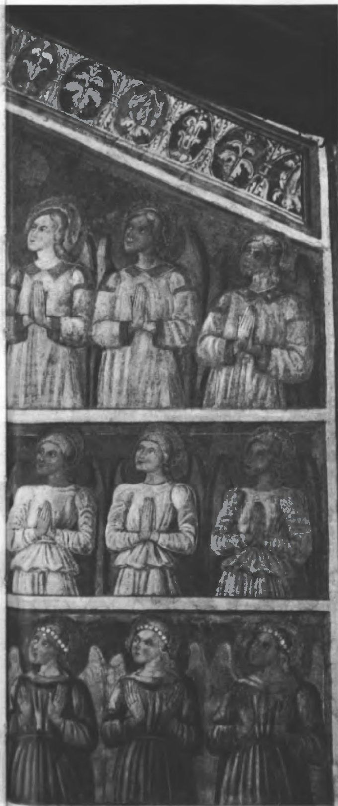
Fig. 37. I nove cori angelici (particolare della controfacciata orientale).