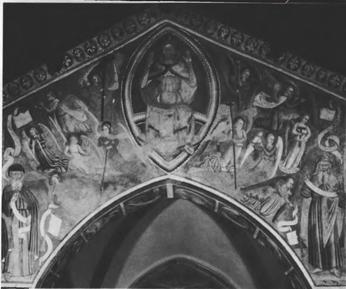
Fig. 31. La sommità dell'arco trionfale con il Pantocratore in gloria.