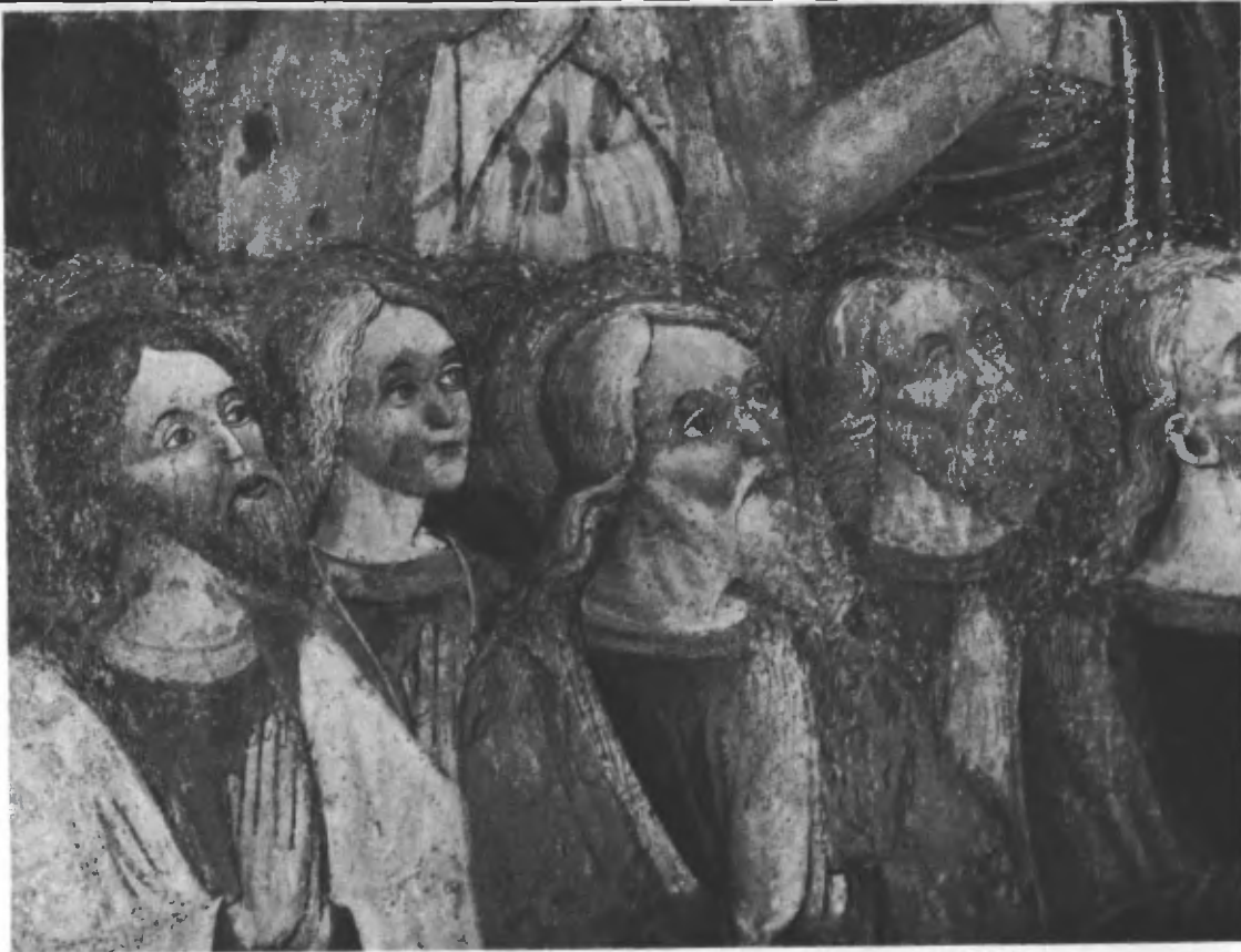
Fig. 12. I beati in paradiso (particolare).