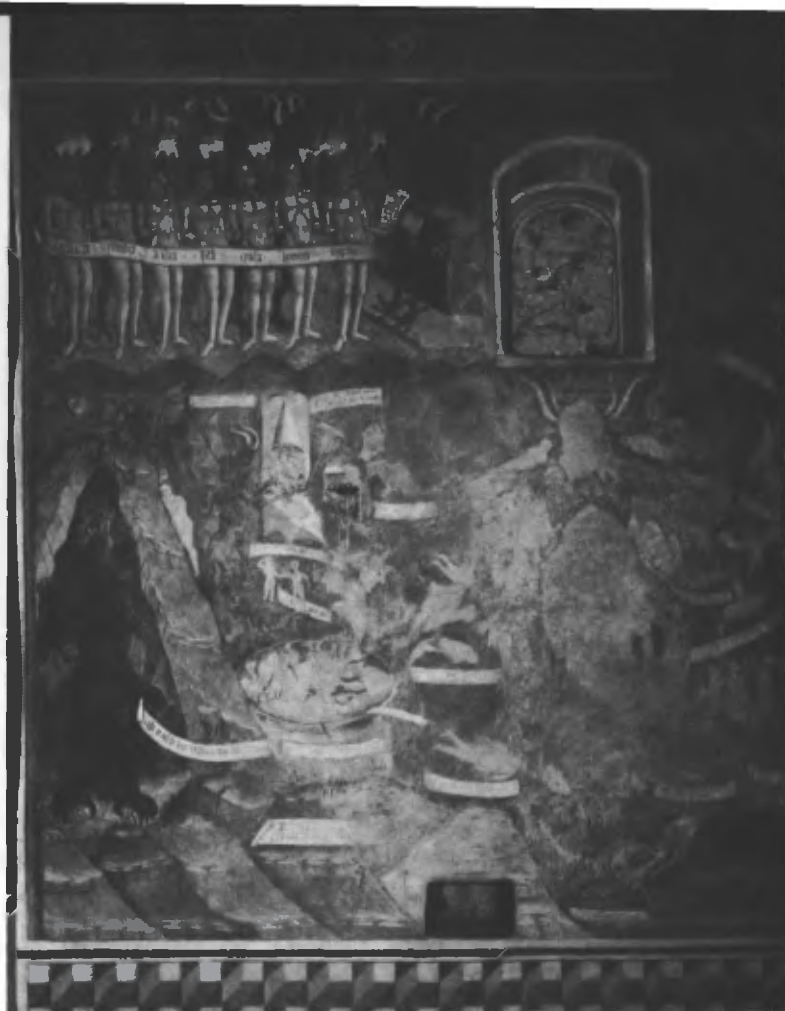
Fig. 23. Parete meridionale: il lato sinistro dell'inferno.