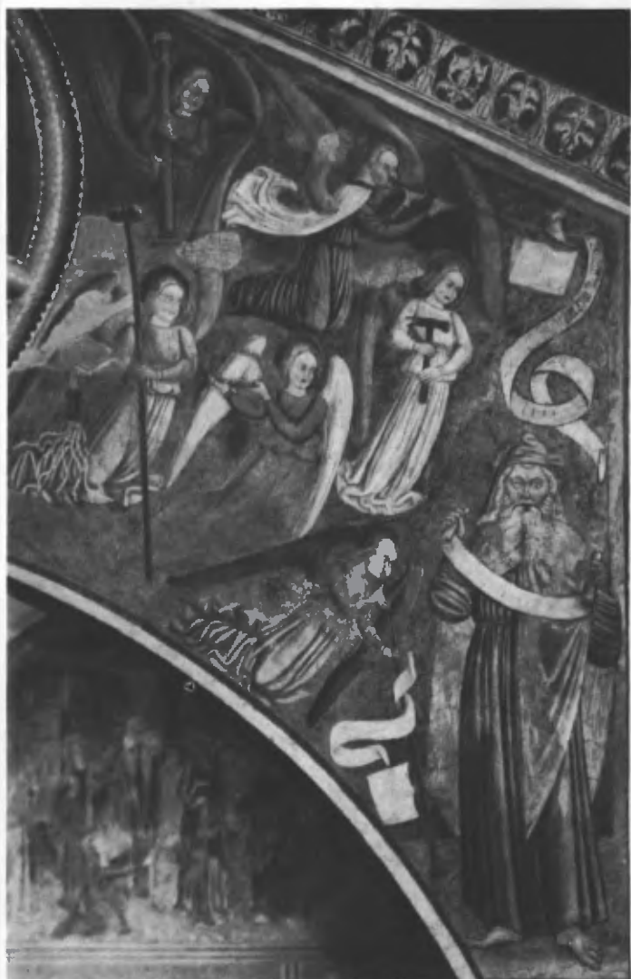
Fig. 33. Sei angeli e un santo, a lato del Pantocratore (particolare dell'arco trionfale).