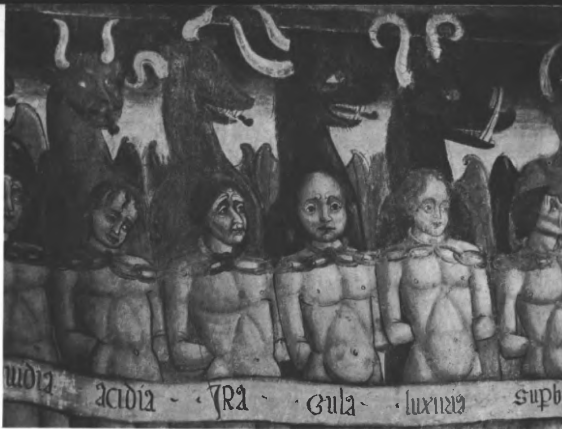
Fig. 25. Particolare dei sette vizi capitali.