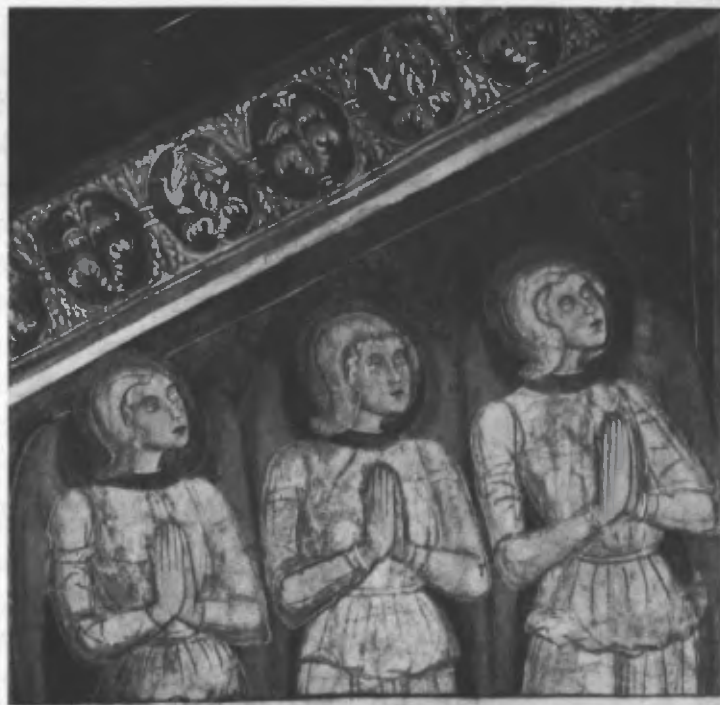
Fig. 38. Particolare dei cori angelici.